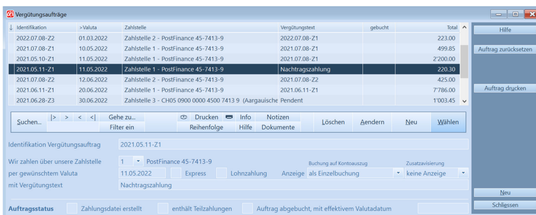
Vergütungsaufträge mit diversen Optionen

Das Programm schlägt das Ausführungsdatum als Name vor. Sie können diesen Vorschlag übernehmen oder einen eigenen Namen wählen.